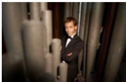
Il crée également en 2007 son Oratorio « L'Arche de Noé », pour chœurs, orchestre et orgue.