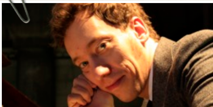
La revue « Organ – Journal für die Orgel » le nomme « Organist of the Year 2007 ».